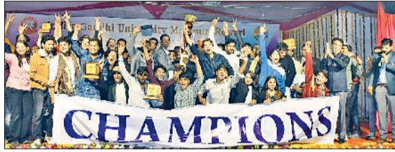
रेवाड़ी। इंटर जोनल युवा महोत्सव की विजेता आरपीएस कॉलेज महेन्द्रगढ़ की टीम

मंगलवार देर रात दोनों दिनों के परिणाम जारी किए गए। इंटर जोनल युवा महोत्सव में आरपीएस कॉलेज ऑफ इंजीनियरिंग एंड टेक्नोलॉजी महेन्द्रगढ़ ने ओवरऑल चैंपियन बनकर प्रथम ट्रॉफी पर कब्जा किया, जबकि यूटीडी आईजीयू