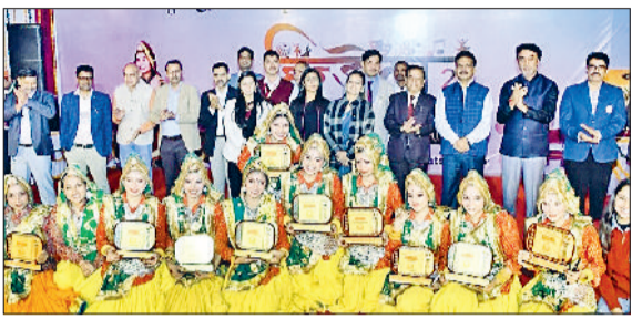
रेवाड़ी। विजेता टीम को पुरस्कृत करते हुए अतिथि।