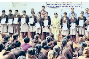
रेवाड़ी। युवाओं को प्रमाण पत्र वितरित करते हुए अतिथि। फोटो: हरिभूमि

बावल। राजकीय स्कूल डिठोला में बावल क्षेत्र के विभिन्न गांवों से जुड़े 330 युवाओं और छात्रों को कंप्यूटर प्रशिक्षण कार्यक्रम की पूर्णता पर प्रमाण पत्र वितरित किए गए। कार्यक्रम का आयोजन युवाओं को आत्मनिर्भर बनाने, डिजिटल कौशल बढ़ाने और रोजगार के नए अवसर उपलब्ध कराने की दिशा में किया गया। उने मिंडा समूह की सामाजिक करतें हुए अतिथि। फोटो: हरिभूमि