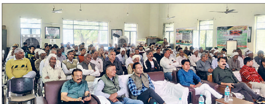
रेवाड़ी। कार्यक्रम में मौजूद अधिकारी व किसान।