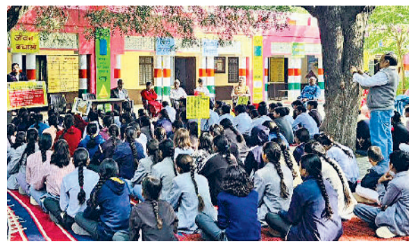
रेवाड़ी। विद्यार्थियों को जानकारी देते हुए पुलिस टीम।