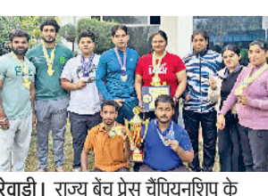
रेवाड़ी। राज्य बैंक प्रेस चैंपियनशिप के विजेता खिलाड़ी।