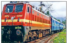
रेवाड़ी। उत्तर-पश्चिम रेलमार्ग से गुजरती एक्सप्रेस ट्रेन।

रेलवे की ओर से चूरू-सादुलपुर रेलखंड पर दुधवाखारा-अस्सल एवं दुधवाखारा-हडवाला स्टेशनों के बेरली गांव पेट्रोल पंप स्थित कार्यालय में हुई। बैठक में आगामी 22 नवंबर को रेवाड़ी में होने वाले प्रदर्शन को लेकर रूपरेखा तैयार की गई। सर्वप्रथम देश की आयरन लेडी पूर्व प्रधानमंत्री स्व. इंदिरा गांधी की जयंती पर श्रद्धांजलि अर्पित की गई।