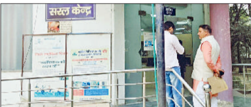
रेवाड़ी। लघु सचिवालय स्थित सरल सेवा केंद्र।