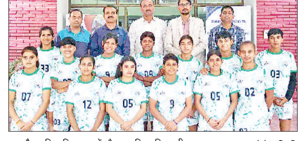
नारनौल। विश्वविद्यालय में मौजूद महिला खिलाड़ी।

जिला स्तर पर टॉप टेन में चुने गए सभी विद्यार्थी राज्य स्तरीय विज्ञान निबंध लेखन प्रतियोगिता में भाग लेंगे। राज्य स्तर पर प्रथम स्थान प्राप्त करने वाले विद्यार्थी को 10 हजार, द्वितीय को आठ हजार व तृतीय विद्यार्थी को छह हजार पुरस्कार राशि प्रदान की जाएगी, साथ ही 10 विद्यार्थियों को तीन-तीन हजार रुपये के सांत्वना पुरस्कार दिए जाएंगे।