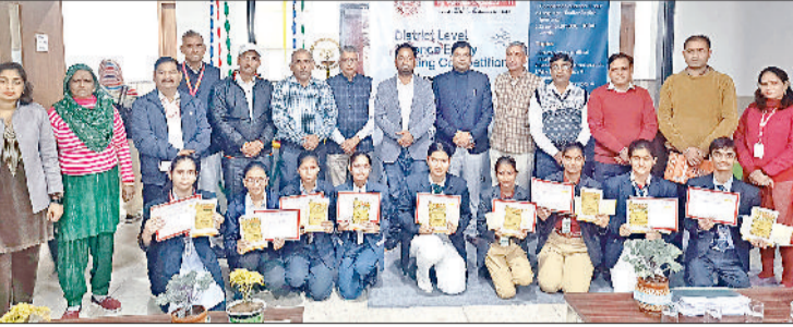
नारनौल। प्रतियोगिता के विजेता विद्यार्थी।