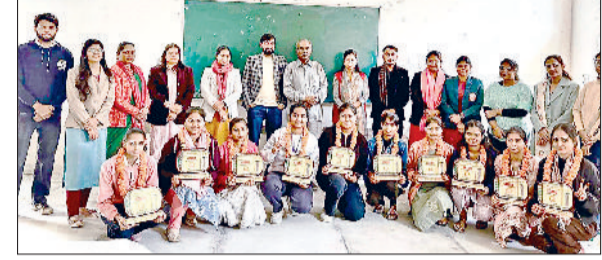
महेन्द्रगढ़। छात्राओं को सम्मानित करते हुए।

नारनौल। सिंधानिया विश्वविद्यालय परिसर में खेलो इंडिया एवं यूथ कबड्डी को बढ़ावा देने के उद्देश्य से वर्ल्ड कबड्डी कैम्प आयोजित किया जा रहा है। यह कैम्प 27 नवंबर तक संचालित होगा। कैम्प में किसी भी विद्यालय, कॉलेज या संस्थान की इच्छुक लड़कियां भाग ले सकती हैं। पंजीकरण के लिए रजिस्ट्रेशन शुल्क मात्र 500 रुपये रखा गया है, जबकि कैम्प अस्थि के दौरान प्रतिभागियों के रहने खाने की व्यवस्था पूरी तरह नि:शुल्क रहेगी।