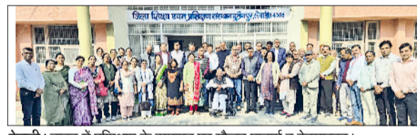
रेवाड़ी। डाइट में प्रशिक्षण के समापन पर मौजूद प्राचार्य व हेडमास्टर्स।

स्कूल लीडरशिप विभाग एससीआईआरटी हरियाणा गुरुग्राम के तत्वावधान में डाइट हुसेनपुर में 'राष्ट्रीय शिक्षा नीति के कार्यान्वयन के रोडमैप' विषय पर चल रहे विद्यालय मुखियाओं के तीन दिवसीय प्रशिक्षण कार्यक्रम का बुधवार को समापन हो गया। सीबीएसई से मान्यता प्राप्त विद्यालयों को छोड़कर जिले के 41 प्राचार्यों व 5 हेडमास्टर्स ने ट्रेनिंग में भाग लिया। सीबीएसई से मान्यता