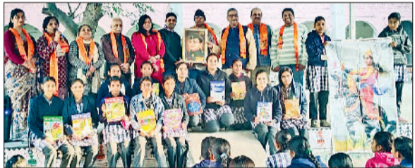
रेवाड़ी। कार्यक्रम में मौजूद शिक्षक व छात्र।